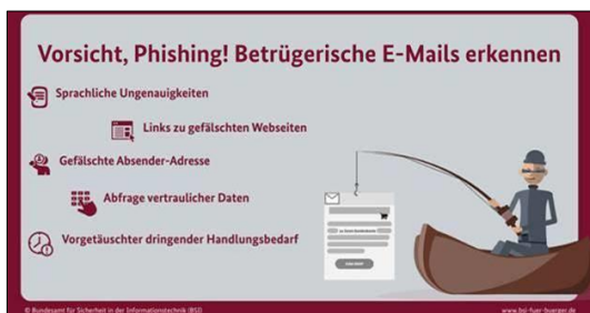
Merkmale von Phishing-E-Mails

Aus dem Arbeitsalltag sind E-Mails nicht mehr wegzudenken. Wichtige Informationen werden einfach direkt im Text oder im Anhang übermittelt – allerdings bieten sie auch eine gute Möglichkeit für IT-Angriffe. Beispielsweise sollen durch Phishing-E-Mails Nutzende auf eine bössartige Internetseite gelockt oder Computerschädlinge aus dem Anhang installiert werden. Diese E-Mails haben inzwischen eine bemerkenswerte Perfektion erreicht. Doch mit einem wachsamem Auge und Training fällt das Erkennen nicht mehr schwer.