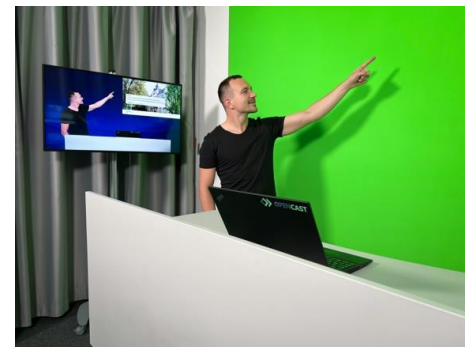
Self Recording Studio im MMZ

Videos in Eigenregie: Mit dem neuen Self Recording Studio am Ernst-Abbe-Platz 8 steht allen Lehrenden flexibel ein Aufnahmeraum zur Verfügung, um in professioneller Umgebung Videoclips für die Lehre aufzuzeichnen – klassisch wie im Hörsaal oder mittels Greenscreen.