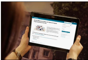
Anmeldung in Mahara

Als E-Portfolio- und Vernetzungsplattform kann seit Anfang 2024 ein neuer universitätsweiter Dienst genutzt werden. Auf Mahara ist es möglich, sich lehrveranstaltungsübergreifend auszutauschen und sich z.B. in Lerngruppen, Sprachtandems oder Schreibpartnerschaften zu vernetzen. In der Portfolioarbeit können mit verschiedenen Inhaltstypen erworbene Kompetenzen in Lerntagebüchern dokumentiert werden. Mahara fördert damit die Selbstreflexion, Zusammenarbeit und Peer-Learning.